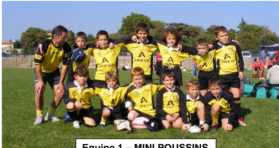
Equipe 1 – MINI POUSSINS