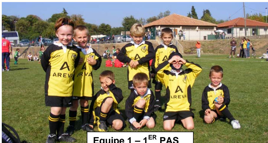
Equipe 1 – 1 ER PAS