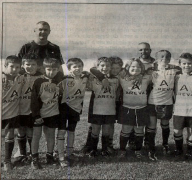
Les poussins du RCBM constituent une bande de copains.

Au cours du deuxième match, l'adversaire s'est fait plus coriace, mais les poussins du RCBM ont montré qu'ils ne manquaient pas de caractère.