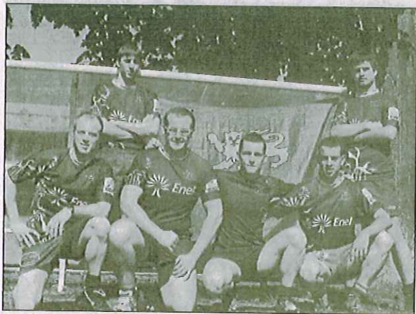
L'équipe du ROC a fini troisième à Clermont-Ferrand.

Cette compétition a été l'occasion de représenter le club et de prolonger la saison ovale avec le rugby à toucher, qui sera de nouveau à l'honneur cet été, à l'occasion du Beach Rugby Tour (15 juillet et 13 août sur la plage de Sciotot).