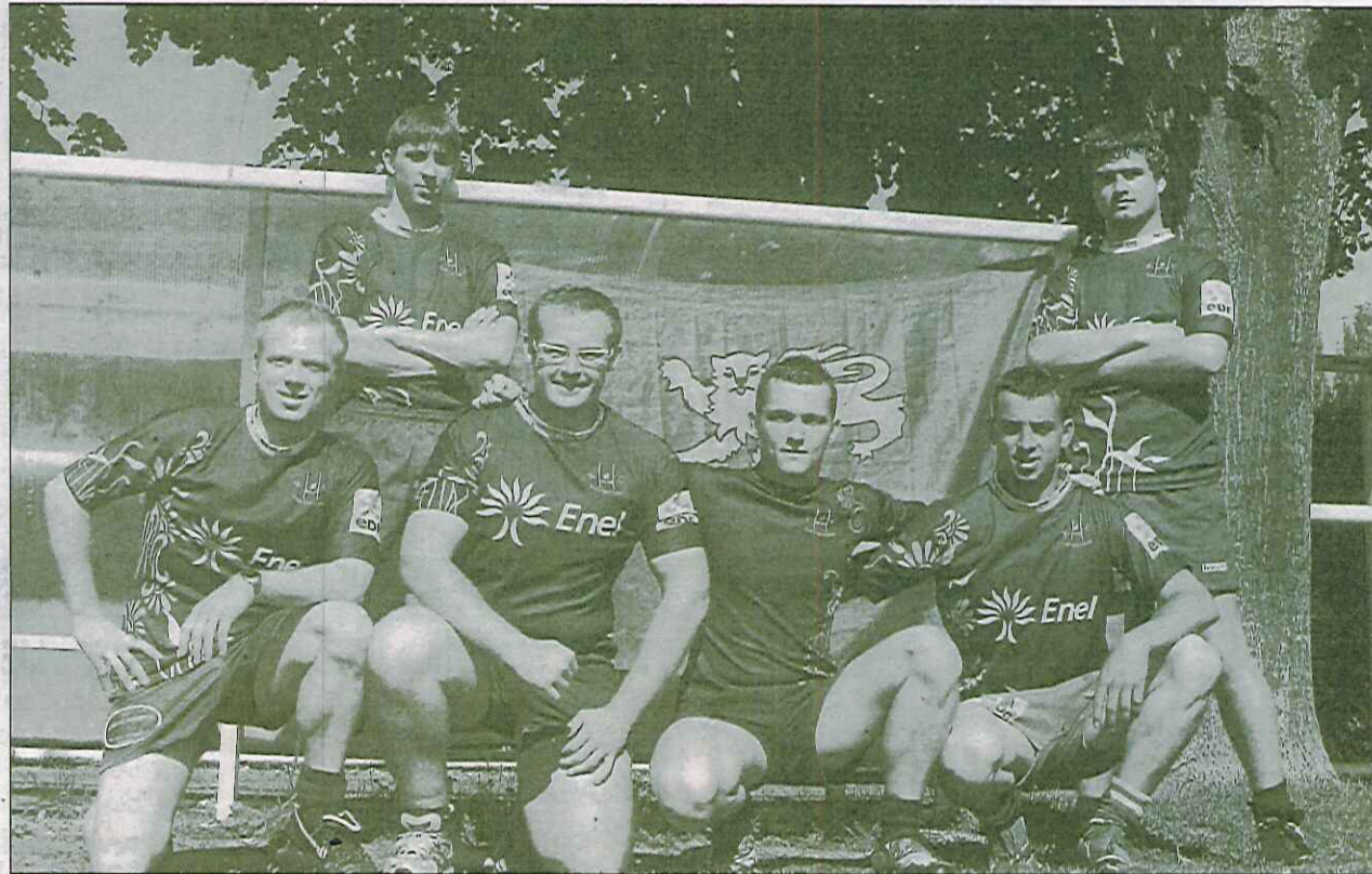
Une saison qui se termine en beauté pour les rugbymen du Roc.

L'ultime étape nationale de la saison 2009-2010 de rugby à toucher, se déroulait ce week-end à Clermont-Ferrand. C'est sous un soleil radieux qu'une poignée de Rocquets sont descendus représenter la Normandie contre les comités de Bourgogne, du Centre, d'Ile-de-France, du Lyonnais, de Midi-Pyrénées, du Périgord-Agenais et de Poitou-Charentes, afin de ramener le bouclier. Aux pieds des volcans d'Auvergne, la tâche s'annonçait rude face à des équipes au grand complet, déjà habituées à cette nouvelle pratique rugbystique. En finissant premiers de leur poule le matin, les bleu et blanc ont décroché une place en demi-finale, perdue de justesse face à Conflans-Herblay. Le match pour la troisième place a été remporté par des Rocquets surmotivés, désireux de prouver que le Cotentin avait bel et bien sa place sur la carte de France du rugby. Cette compétition a été l'occasion de représenter le club et de prolonger la saison ovale avec le rugby à toucher, qui sera de nouveau à l'honneur cet été, à l'occasion du Beach Rugby Tour (15 juillet et 13 août sur la plage de Sciotot).