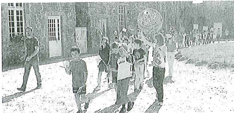
Défilé dans les rues de Flamanville avec les affiches.

La coupe de rugby du canton s'est déroulée jeudi 24 et vendredi 25 juin sur le stade du château. Les classes de CP, CE1, CE2 et CM1 de Sotteville, Sideville, Héauville, Siouville, Flamanville, Surtainville et Les Pieux, soit 280 enfants, se sont retrouvées pour conclure l'activité rugby animée par le Rugby Ouest Cotentin (Roc). « Avant de débiter les matchs, les