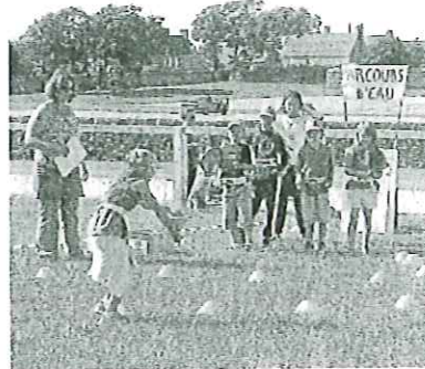
Départ pour le jeu de l'eau.

À la rentrée 2010, l'accompagnement à la scolarité repartira dans les communes concernées. « Les